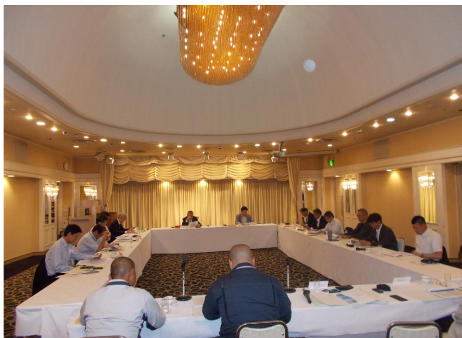
福島県生コンクリート品質管理監査会議の模様