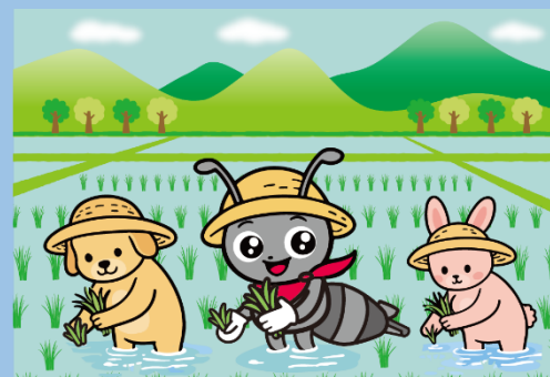
なまリンちゃん (全生連イメージキャラクター)

〒960-8035 福島市本町5-8 福島第一生命ビルディング 6F TEL 024-523-1695 FAX 024-522-3685 E-mail fukusima@zennama.or.jp