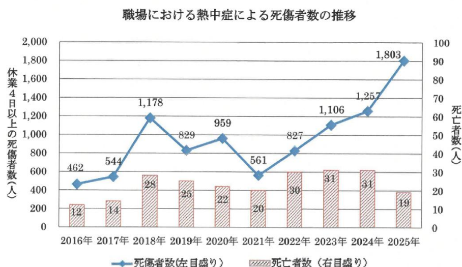
2025年(令和7年)職場における熱中症による死傷災害の発生状況(確定値)

※ 各年の確定値は、1月1日～12月31日までの間に発生した熱中症に係る労働災害で、翌年概ね4月7日までに労働者死傷病報告が提出されたものを集計したもの。